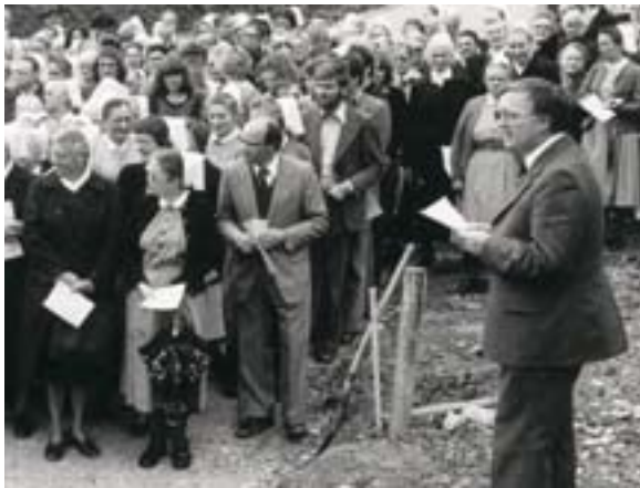
Spatenstich auf dem Teurershof

13 Jahre nach der Gründung der evangelischen Diakonissenanstalt (1886) in Schwäbisch Hall war fast schon ihr Ende erreicht. Der Gründer, Pfarrer Faulhaber, war mit dem Bankrott seiner Industrien, die die Diakonissenanstalt finanzieren sollten, konfrontiert.