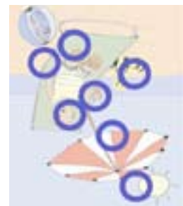
Die Lösungen Fehlersuche:

Keiner von ihnen hat das richtige Alter erraten. Doch eine Mutmaßung war nur um ein Jahr, eine andere um drei Jahre, eine dritte um sechs Jahre und eine vierte um neun Jahre falsch. Wie alt ist die Lehrerin?